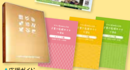
▲応援ガイド 発行済み冊子の全データを公開 (ブログ・インスタグラムでご案内)