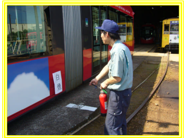
車両火災を想定した教育訓練